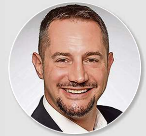
Von Olivier Diethelm

So mit 14, 15 Jahren haben wir während den Papiersammlungen meistens so Heftli wie «Schlüsselloch» oder «Praline» gefunden, also eher harmlose Erotikheftli mit «blutte» Frauen darin. In der prädigitalen Zeit gab es Hardcore nur am Kiosk im Gestell ganz oben hinten oder im Hinterzimmer der Videothek. Das bildete noch einen gewissen Jugendschutz. Heutzutage liegt das Einstiegsalter für Hardcore bei zehn bis zwölf Jahren, wenn Kinder ihr erstes Smartphone mit Internetzugang erhalten. Ich vermute mal, dass viele Eltern nicht die erforderlichen Kenntnisse besitzen, um die Handys ihrer Kinder entsprechend einzurichten. Und selbst wenn, werden findige Kids Mittel und Wege finden, diese Blockaden zu umgehen oder schauen einfach beim Gspänli mit, dessen Handy nicht blockiert ist. Verboten bringt in der Regel nichts. Man kann die Kinder einzig und allein offen aufklären und ihnen erklären, dass die Filme da eben Filme sind und mit der Realität nicht viel gemeinsam haben. Auch Sexting und illegale Inhalte müssen unbedingt thematisiert werden. Die Folgen daraus können verheerende Auswirkungen haben.