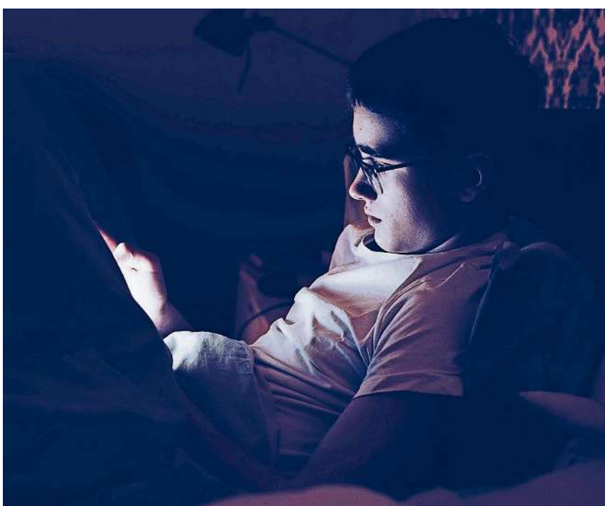
Dank Handy überall und jederzeit verfügbar: Der Konsum von sexuellen Inhalten birgt auch eine grosse Suchtgefahr.

Der neu gegründete Verein «Befreit zum Leben» in Zofingen bietet allen Menschen Hilfe, die unter einem problematischen Umgang mit sexuellen Inhalten im Internet leiden. Über die vom Verein betriebene Website por-no.ch können sich Betroffene völlig anonym melden und beraten lassen.